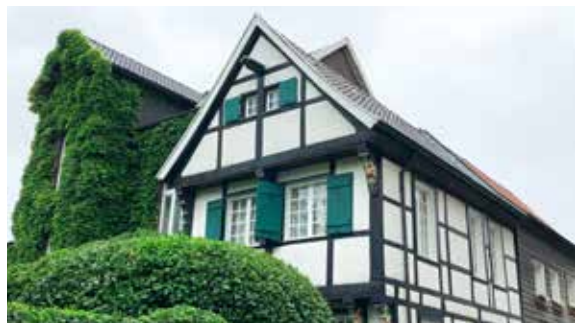
...für Gebäude ohne wasserführendes Heizsystem

ÖkoFEN Heiztechnik GmbH Schelmenlohe 2, 86866 Mickhausen Tel. 08204 / 2980-0, Fax 08204 / 2980-190 E-Mail: info@oekofen.de , www.oekofen.de