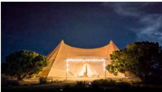
...für Zelte / Veranstaltungen