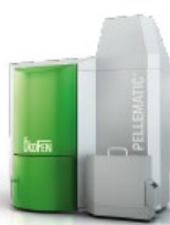
PELLEMATIC La chaudière de référence 12 à 32 kW