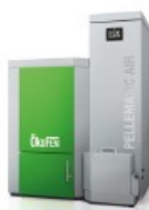
PELLEMATIC AIR Chauffage à air chaud 21 à 30 kW