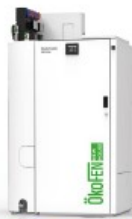
PELLEMATIC HOME Spéciale maison neuve 3 à 10 kW