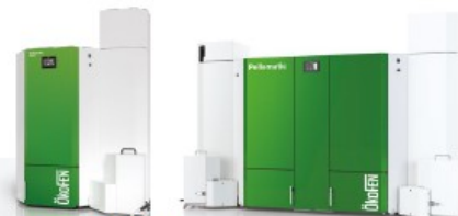
PELLEMATIC MAXI CONDENS Pour les surfaces importantes 41 à 512 kW