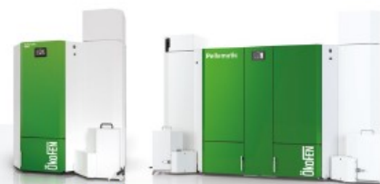
PELLEMATIC MAXI Pour les surfaces importantes 36 à 448 kW