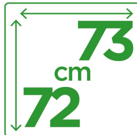
Emprise au sol réduite