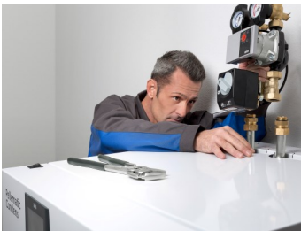
Raccordements hydrauliques directs